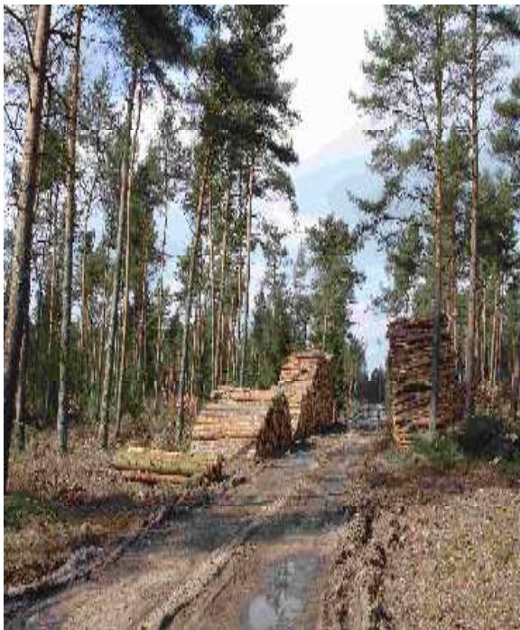
Sturmhölzer sind an einem neuen Weg im Engelbertswald bei Klosterholte bereit gestellt